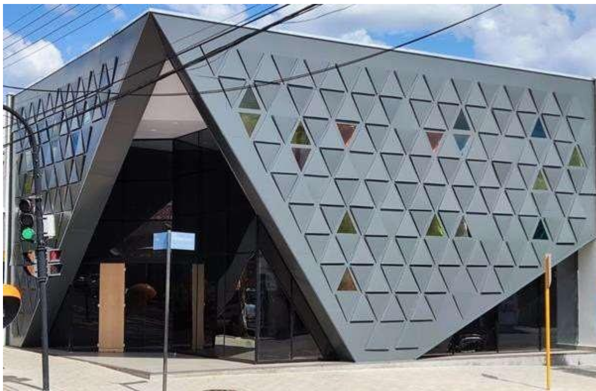
Figura 1 - Foto externa das Faculdades Integradas “Rui Barbosa” - FIRB.