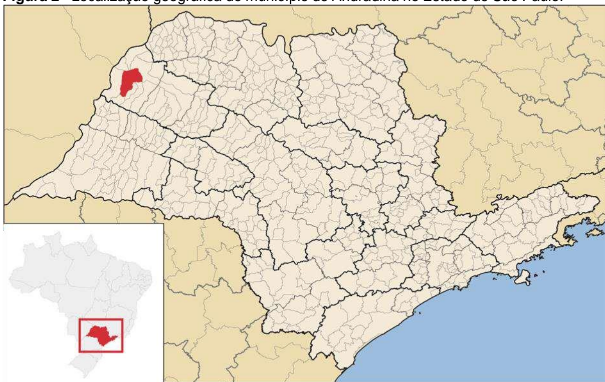
Figura 2 - Localização geográfica do município de Andradina no Estado de São Paulo.

Andradina é um município brasileiro do estado de São Paulo (Figura 2). O município é formado somente pelo distrito sede, que inclui os povoados de Paranópolis e Planalto.