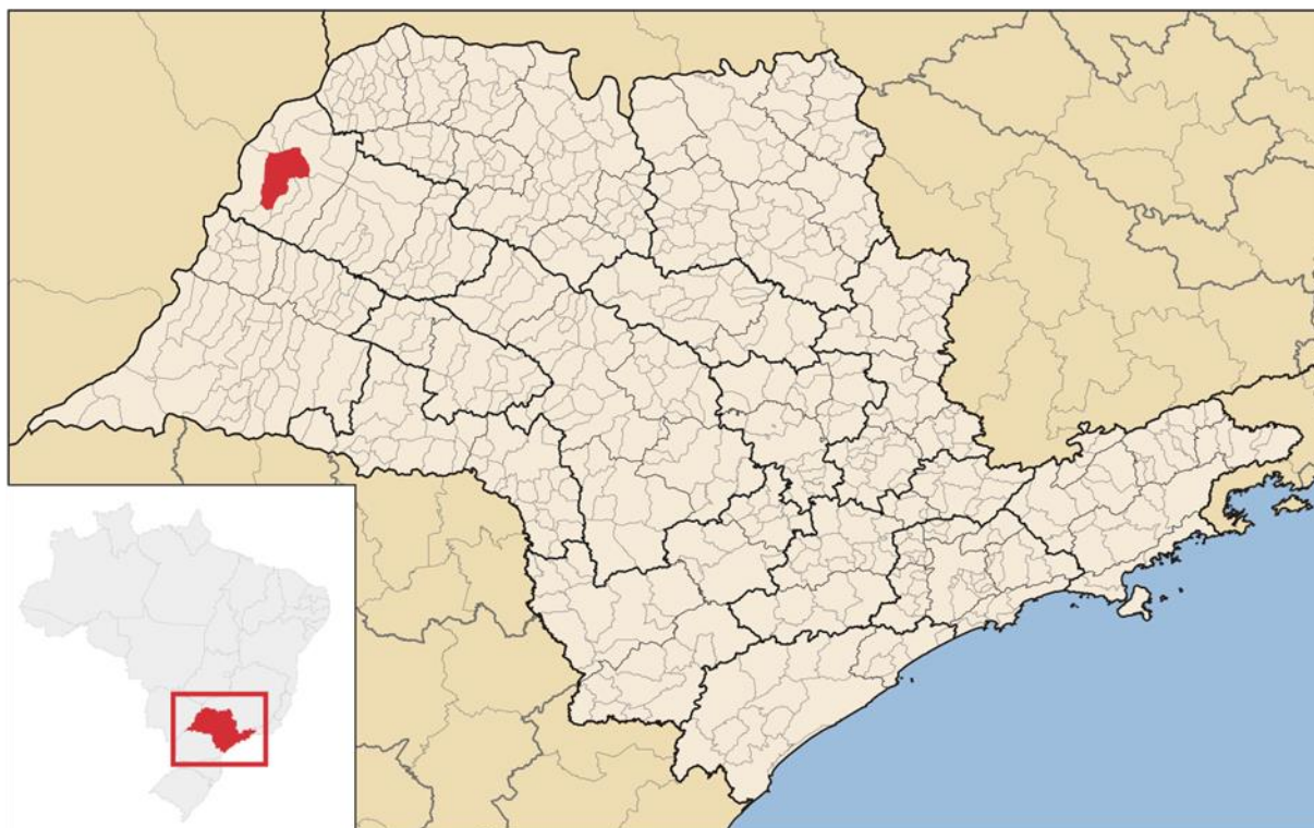
Figura 2 - Localização geográfica do município de Andradina no Estado de São Paulo.

Andradina é um município brasileiro do estado de São Paulo (Figura 2). O município é formado somente pelo distrito sede, que inclui os povoados de Paranópolis e Planalto.