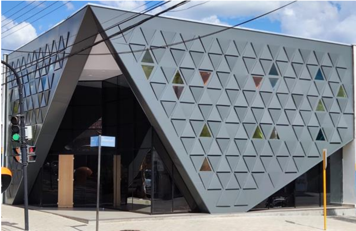
Figura 1 - Foto externa das Faculdades Integradas “Rui Barbosa” - FIRB.

Parecer de n.º 3747/76 do CFE e publicado no DOU de 19 de janeiro de 1977.